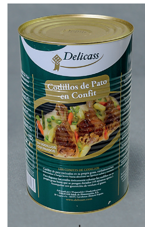
14131 confit codillos lata 24 un