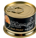
N 20351 bloc foie gras oca trozos 130 gr cuits