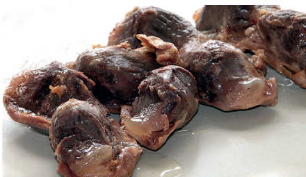
14140 confit mollejas lata 10 un