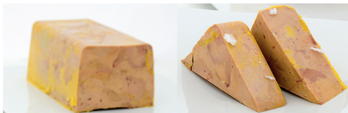
15031 tarrina mi-cuit foie 1 kg 30% trozos añadido Collverd