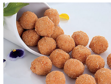
2902013 tentaciones setas 192un*13 gr 2902014 tentaciones queso azul y nueces 153 un * 13 gr