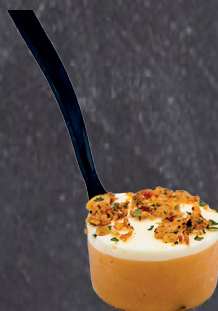
2902431 mini tenedor foie mango 10 gr * 70 un 2902432 mini tenedor cabracho 10 gr * 70 un 2902433 mini tenedor ensaladilla rusa 10 gr * 70 un