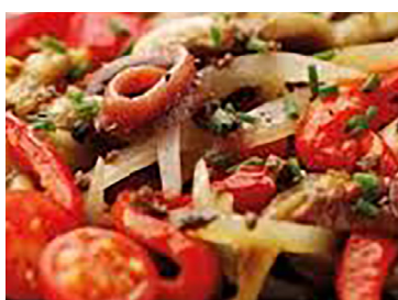
2902004 samfaina 2 kg 2902005 berenjena asada 2 kg