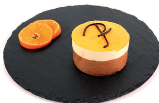
2902960 semifrío café 13u*90g