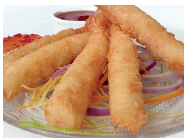
2902225 langostino torpedo panko 2902233 langostino torpedo 10 un