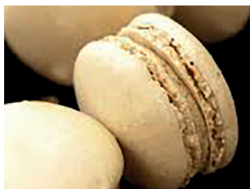
N 290236 macarons foie gras 30 un