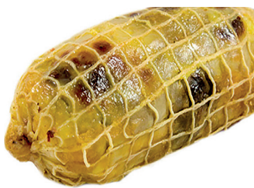
290215 muslo pollo relleno cerdo 350 gr