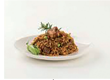
290169 arroz montaña 280gr