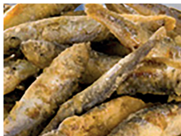
490001401 pescadito enharinado 2 kg