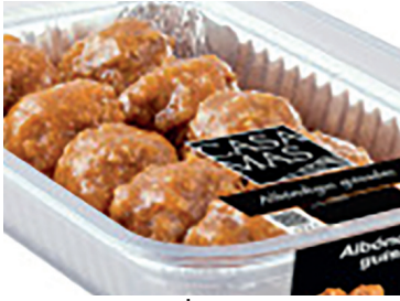
290002160 albondiga guisada 550 gr 290002170 albondiga guisada 1,1 kg N 290002180 albondigas guisadas 275 gr N 290000218 albondigas prefitas 9 un