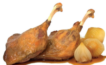
N 290230 poularda confitada 12 muslos