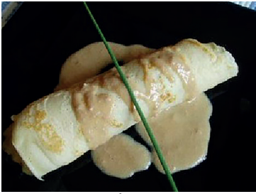
2902621 crep foie y manazana 12 un 2902622 bombón foie +/- 95 un 2902623 foie gelatinado a la manzana 12 un N