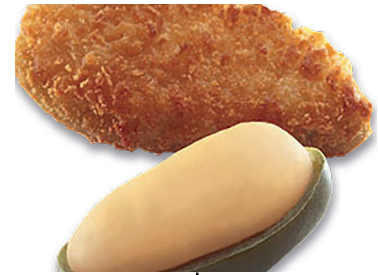
49000184 pimiento piq. bacalao/gamba 1k 49000185 jalapeños cheddar 6*1 kg McCain