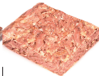
2902683 plancha rabo buey s/hueso 2 kg