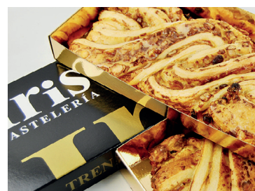
290299 trenza artesana Iris