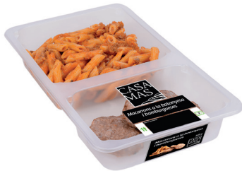
N 29024270 menu ensaladilla + libritos