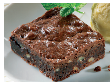
N 29029204 brownie s/gluten davigel 60g*48un