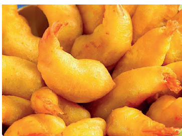
49000144 gamba gabardina 500g