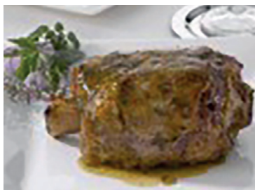
290011 medio codillo finas hierbas paquete 2 pz 650 gr