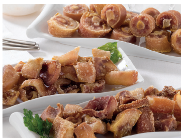
29020081 oreja al ajillo vacío 0,5 kg 2902015 morro cocido extra troceado