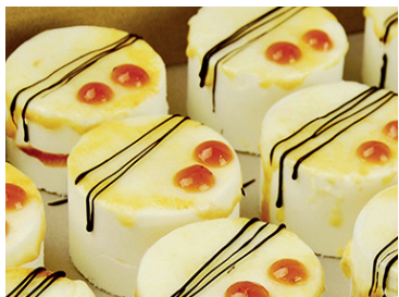
290293 pastelito yogur tomate rosa Iris 75 gr * 12 un