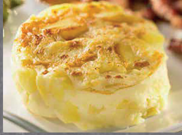
2902665 corona patata anna 2902666 graten patata queso