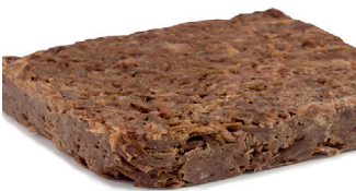
290010 plancha codillo cerdo confitado 850 gr