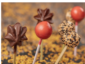
N 290228 surtido 3 chupachups 10g