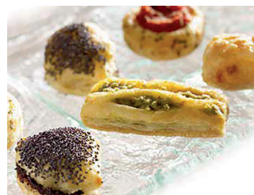
N 290248 surtido hojaldritos 2kg