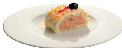
29002022 pastel patata 450 gr