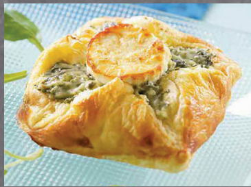
2902675 hojaldre queso cabra