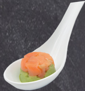
2902730 tartar mini salmon guacamole 10 gr *140