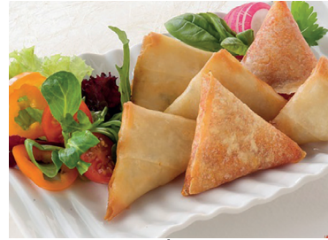
29022320 samosa chistorra 2.5 k 29022321 samosa pollo curry 12 un N 29022322 samosa centolla bo 178 u*14 g N 290238 samosa centolla 15g