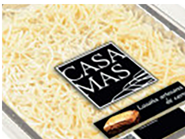
29010080 lasaña artesana 440 gr 29010092 lasaña vegetal 440 gr