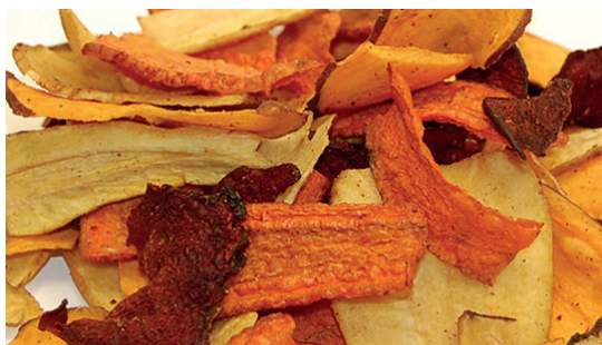
— 290270 chips verduras 350 gr