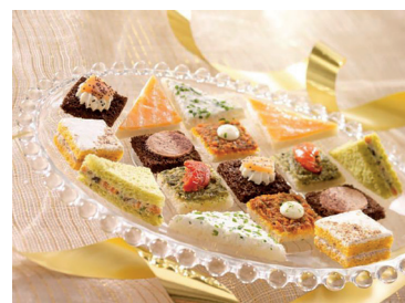
N 2902281 surtido canapes 7gr*160 un N 290247 surtido mini canapes colores 15gr*70 un