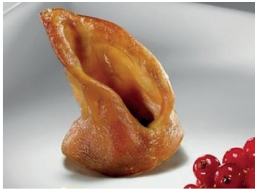
— 290017 oreja cochinito confitada 900 gr N