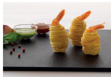
290239 envoltino langostino y patata bandeja 2*500 gr