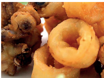
49000140 chipirón enharinado 4*1 kg