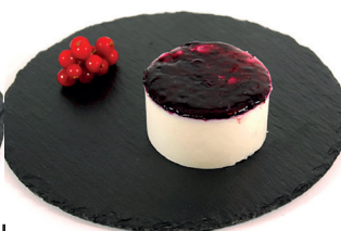
2902964 semifrío maracuya 13u*90g