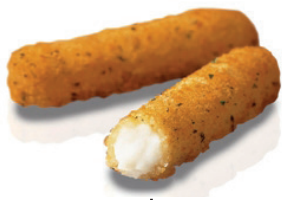
N 49000189 palitos mozzarella 1 kg