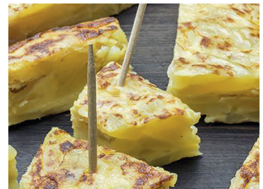
29010020 tortilla patata cebolla 500 gr