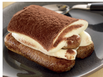
29029203 tiramisu delicioso 5*100gr N