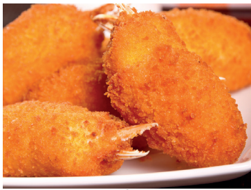
49000002 muslito cangrejo 6*1 kg