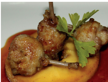
290226 chupachups codorniz 12 un 290227 chupachups codorniz 120 un