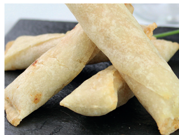
2902224 almohadita morcilla cebolla 15 gr * 130 un 290223 almohadita chistorra cebolla 15 gr * 130 un