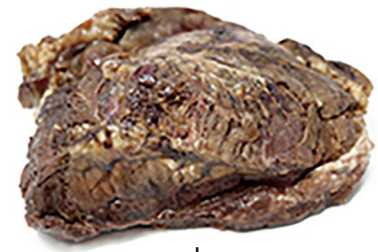
N 2902689 carrillera buey confi- tada aceite 350 gr