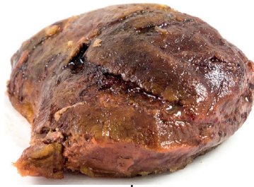
2902690 rabo buey confitado desmigado 1 kg