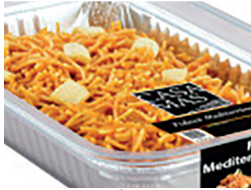
290158 fideua mediterranea 400g 290159 fideua mediterranea 900g 290165 fideua mediterranea 1 r N