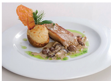
290262 manzana laminada +/- 1600 un