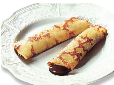
N 29029214 pastel zanahoria 1kg