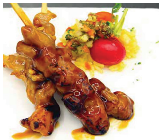
N 290265 brocheta pollo yakitori soja cj. 40und *25gr davigel