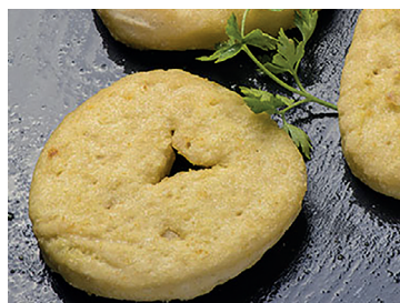
49000147 merluza romana rodaja 4*1 kg N 49000148 merluza romana filete 4*1 kg