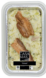
290171 trinxat cerdanya N