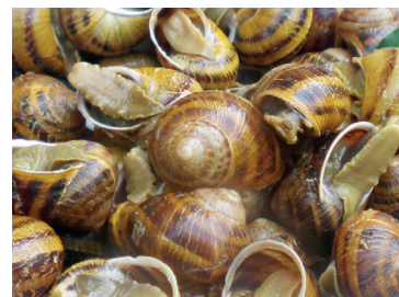
2902176 caracol semi cocido 1 kg