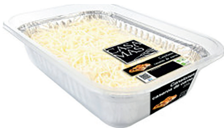
290150 canelón casero 350 gr