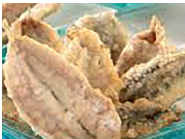
490001406 boquerón en tempura 2 k