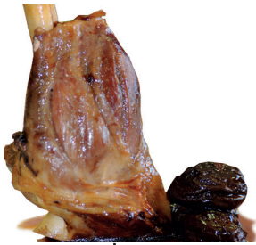
2902663 jarrete cordero confitado 300g