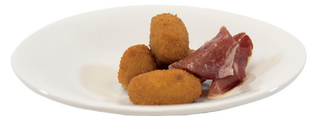
290201430 croqueta bacalao 10 un