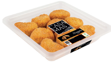
290002200 nuggets 150 gr N