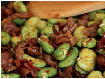
49000131 salteado habitas c/bacon