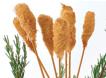
2902661 brocheta langostino marinada 2902226 langostino tempura 20 un N