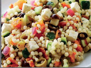
290013 ensalada asiatica 2900130 ensalada mejicana 2900131 ensalada est. griego