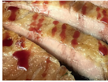
N 2902693 secreto iberico confitado bd 4 raciones de 130gr