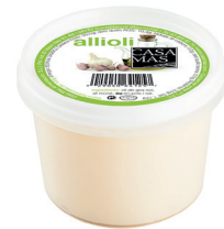
26005330 alioli 500 gr