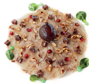
N 29024350 carpaccio manitas cerdo deshuesadas 80gr*10