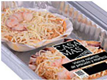
290156 vieira pesc marisco 420 gr