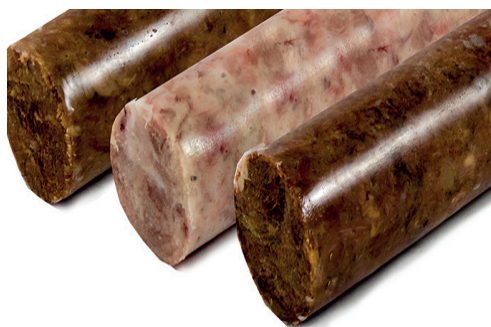
290267 rulo rabo buey s/ hueso confitado 900 gr