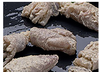
490001402 puntilla enharinada 4*1 kg Froxa