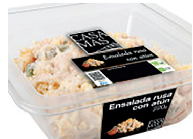
2900210 ensaladilla rusa 220 gr 29002110 ensaladilla rusa 500 gr