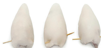
N 49000139 calamar rell. 10/20 10% 6kg