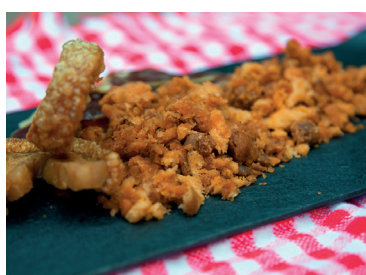
N 2902423 migas aragonesas 150gr