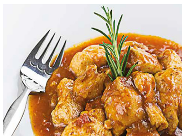
290224 pollo chilindron pimenton davigel 3*2kg N