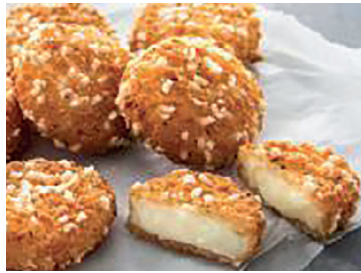
N 4900179 bocaditos camembert Lambweston