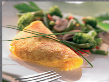
2902669 tortilla francesa