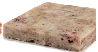
2902685 plancha manita cerdo s/hueso 2 kg