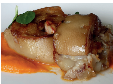
290217 mano cerdo rellena 10 * 14 g