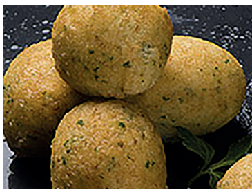
490001408 dados bacalao temp. 2kg 49000141 buñuelos bacalao Froxa 1k