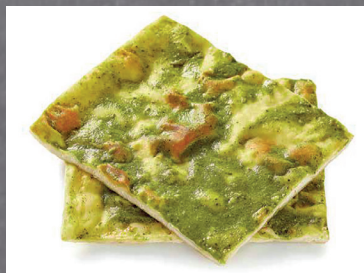
2902676 focaccia finisima al pesto