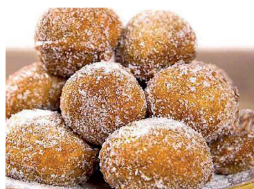
290288 buñuelos viento