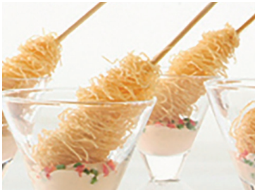
290266 brocheta nido langostino 1,5 kg 115 un * 13 gr