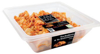
290167 tortellini boloñesa 280 gr N