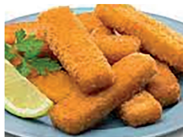
49000145 varitas merluza 4*1 kg