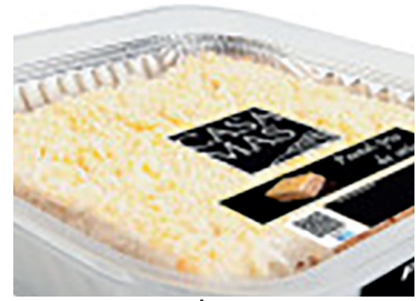
2900200 pastel frío atún 400 gr 29002030 pastel frío atún 1 r N 29002010 pastel frío marisco 400 gr