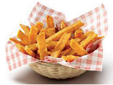
N 49000172 boniato Lambweston 4*2,5 kg