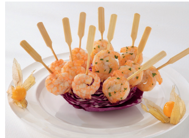
2902662 piruleta langostino mari- nada 2 gr * 111 un