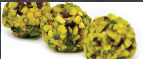
29024291 esfera foie higo avellana 9gr * 54 un 2902430 esfera gorgonzola manzana pistacho 9 gr * 54 un