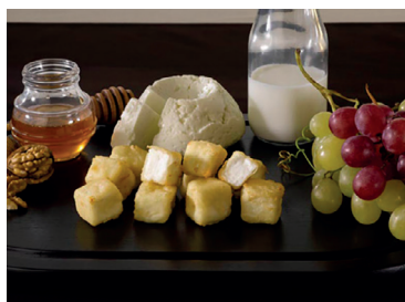
2902020 queso fresco tempura 500 gr