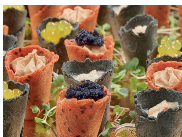
N 290229 surtido 2 cucuruchos 15g