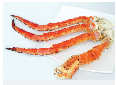
490000740 patas araña cocida cong. N