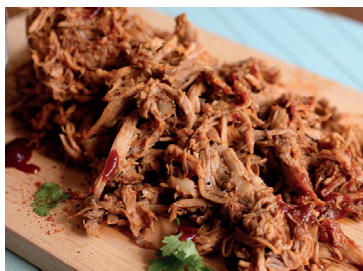
290012 pulled pork bolsa 1,5 kg