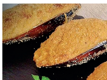
49000149 mejillón relleno tigre 1 kg