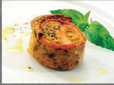
2902668 timbal medit.