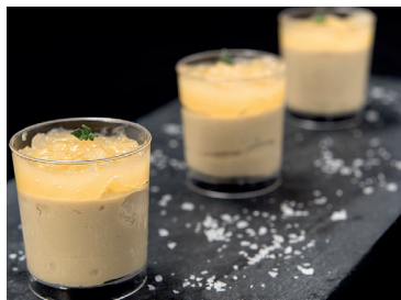
290234 mousse bacalao pimiento