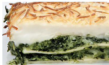
29010095 lasaña espinacas 350 gr Matachín