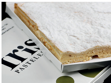
2902971 pastel ruso Iris