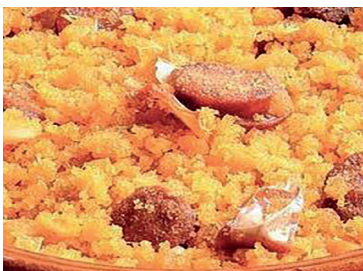
N 29010105 migas preco. 400gr