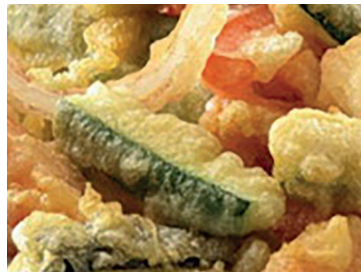
49000182 verduras tempura 1 kg 49000180 calabacín rebozado 1 kg