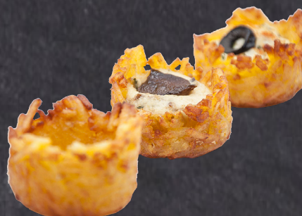
290246 cestillo mini patata frita 6 gr * 54 un 2902460 cestillo mediano patata frita 14gr*10un