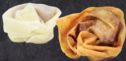
29024342 crujiente gamba ajillo 14 gr * 75 un 2902435 crujiente ternera teriyaki 14 gr * 75 un