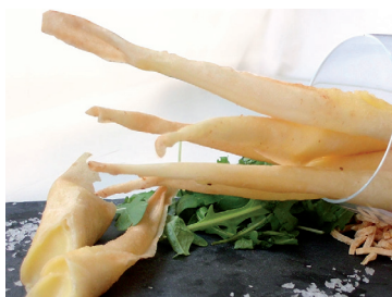
2902021 twister cheddar cebolla caramelizada 20 gr * 40 un