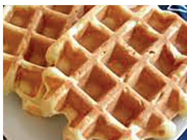
2902870 gofres liege 90 gr* 24 un