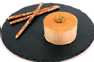
2902961 semifrío yogur arándanos 13u*90g