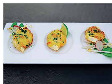
290240 pollo jamoncitos chilindrón 2.5-3 kg N