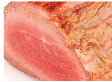
2902691 roast beef ternera confitado 1 kg