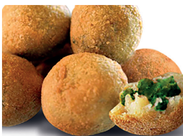
49000188 bolitas queso picates 6*1 kg