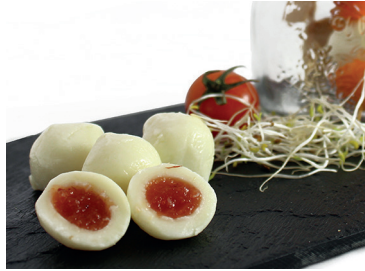
2902231 bolitas mozza. membrillo 2902232 bolitas mozza. cebolla