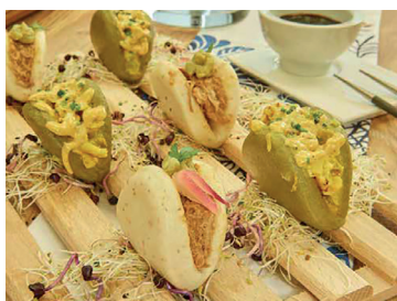
N 290485 pan bao 50gr*40 un