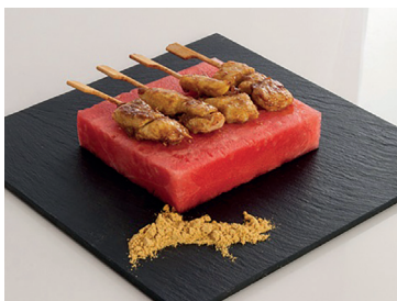
290264 mini brocheta pollo curry dulce 60 un*25 gr