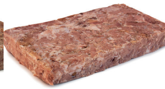
290018 plancha cochinito 900 gr confitado