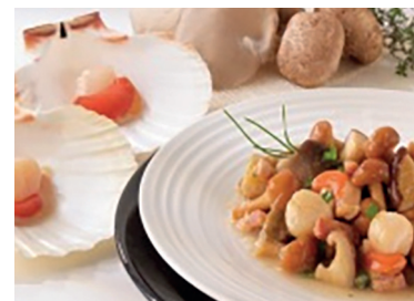
N 49000130 salteado de vieiras y setas