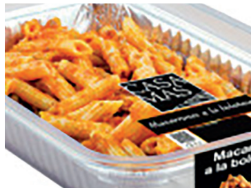
290164 macarrón boloñesa 1 r N 290163 macarrón boloñesa 500 gr N