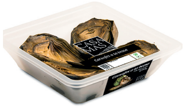
29010030 alcachofa brasa 240gr