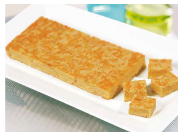
290225 plancha tortilla patata cebolla 10*750gr N