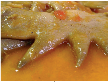
290008 crestas gallo 500 gr