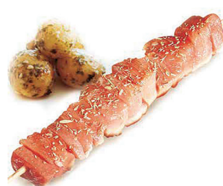
290222 brocheta pavo Davigel 38*130gr N