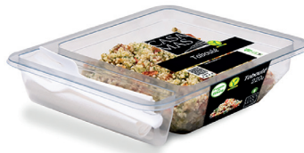
N 29001150 taboule 220 gr