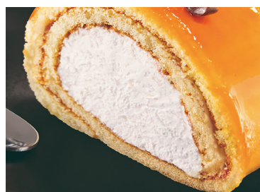
2902972 brazo nata yema Iris