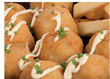
49000156 albondiga pescado (65% merluza) 1kg N