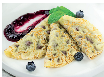
N 290292 mini crepe grosella negra N 2902920 mini crepe manzana