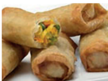
49000170 rollito oriental 80 gr 3 kg