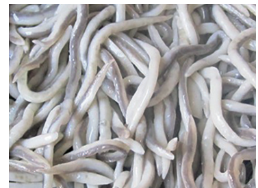
49000001 frulas (gulas) 200 gr