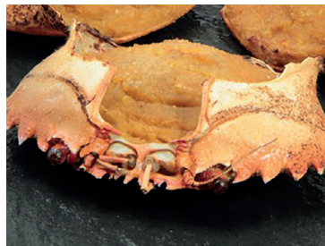
49000074 caparazón necora 50un*40gr