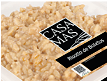
290161 risotto boletus 250 gr