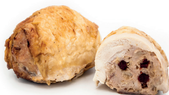
N 290276 capón relleno foie y arandano 150 gr