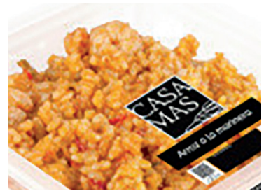
290160 paella marinera 280 gr