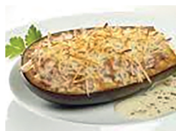
49000179 berenjena rebozada 5*1 kg