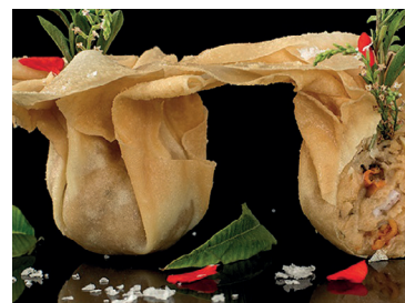
290220 saquito marisco 100 un * 15 gr 290221 saquito boletus 100 un * 15 gr